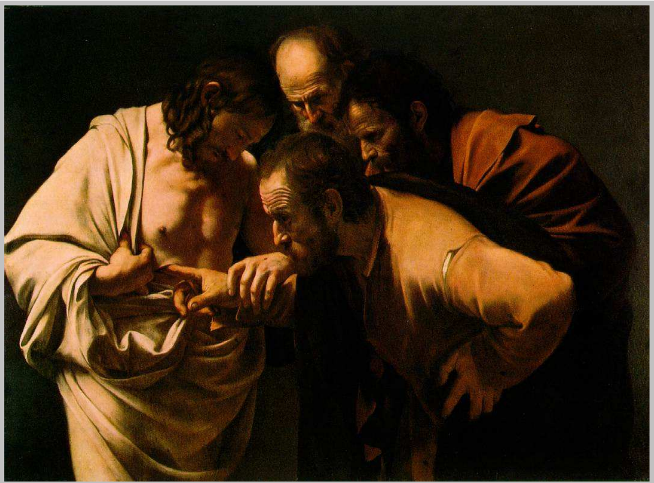
Incredulità di San Tommaso, Potsdam Bildergalerie, Michelangelo Merisi detto il Caravaggio 1600-1601